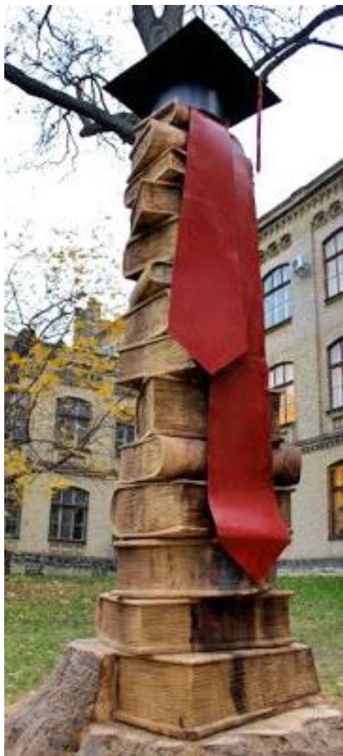
Сходи знань, НТУУ "КПІ"